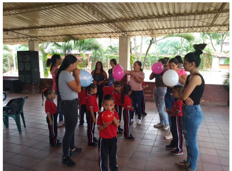
Convivencia del grado preescolar