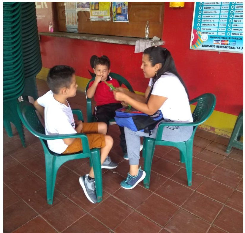
Expresión de sentimientos a través de la terapia de la carta